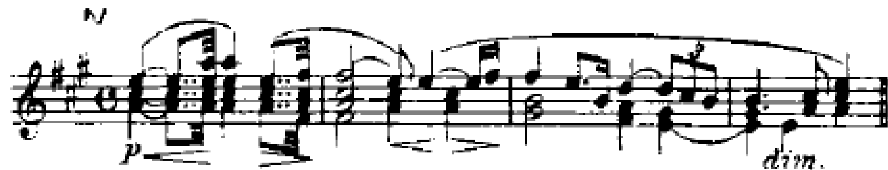
2а. Лоэнгринa – посланца Грааля.